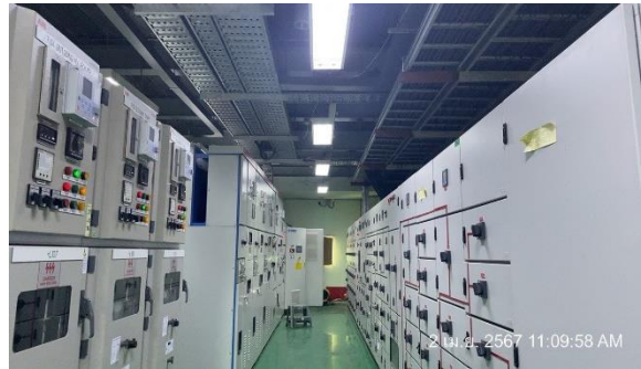
รูปที่ 28 หลอดไฟส่องสว่าง