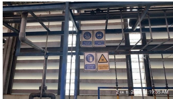
รูปที่ 29 ป้ายเตือนอันตรายบริเวณที่มีความเสี่ยง