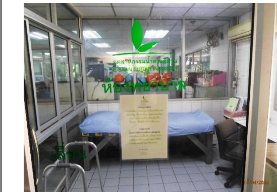
รูปที่ 30 อุปกรณ์ปฐมพยาบาลเบื้องต้น