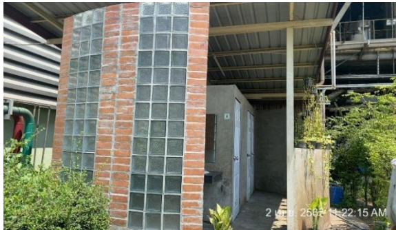
รูปที่ 27 ห้องสุขา